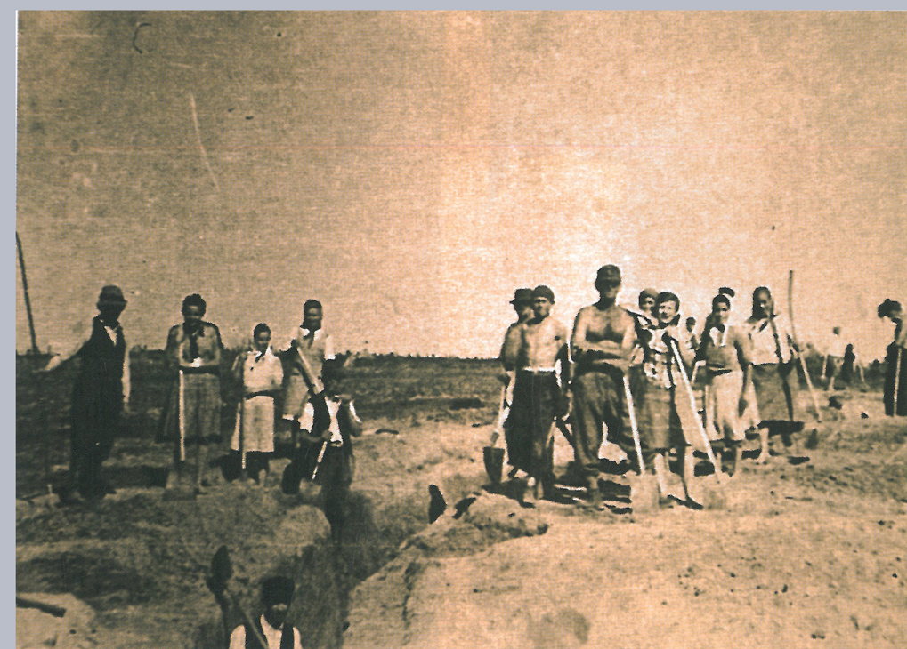
Prace przy kopaniu okopów w Kobylu z udziałem ludności więzionej w niemieckim obozie pracy.